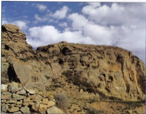
Vista del Castillo en la parte alta del pueblo.

La historia de Allepuz no puede desligarse de la Comunidad de Teruel. A partir de la sentencia de Escorihuela en el 1277 el territorio de la Comunidad se dividió en sesmas formadas por agrupaciones de varias aldeas. En el siglo XIV ya estaban constituidas las seis sesmas definitivas. Allepuz con Monteagudo, Mosqueruela, Camarillas, Ababuj, Gúdar, Cedrillas, Aguilar del Alfambra, El Pobo y Valdelinares formaban la Sesma del Campo de Monteagudo. La Comunidad de Teruel existió durante casi seiscientos años, hasta que un Decreto de 1837 la suprimió.